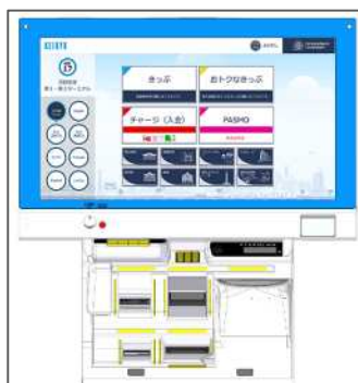
自動券売機（イメージ）