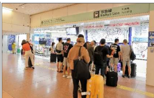
インバウンド旅客で賑わう 羽田空港第3ターミナル駅