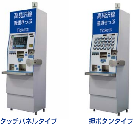
タッチパネルタイプ

設置される駅のロケーションに合わせて、接客面の仕様はタッチパネルタイプ、押ボタンタイプの2種類をラインアップしました。