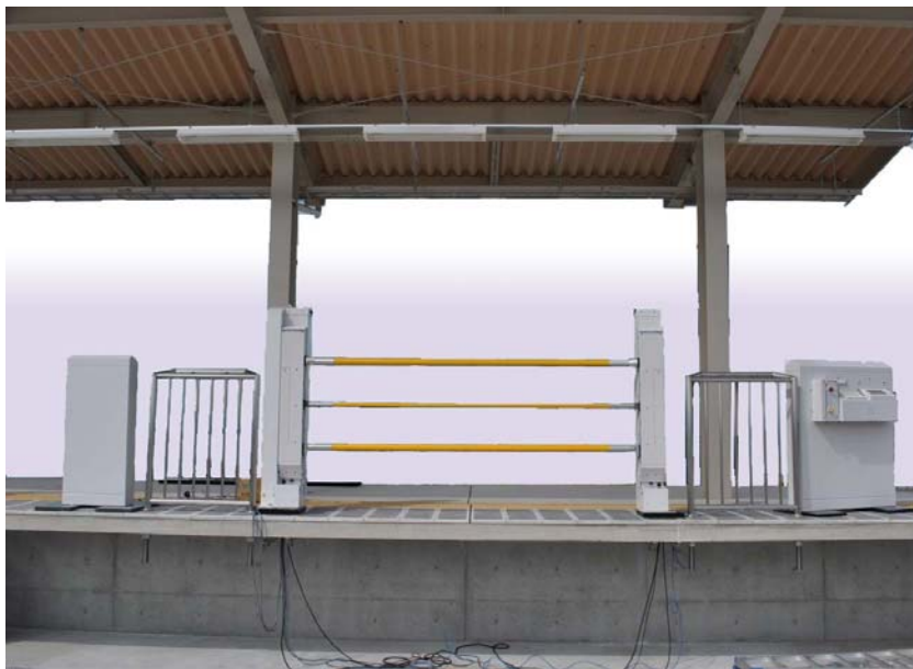
弥生台駅に設置される昇降式ホームドア (イメージ)

なお、この実証試験は国土交通省鉄道局の鉄道技術開発費補助金の支援を受けて行われるものです。 概要は別紙のとおりです。